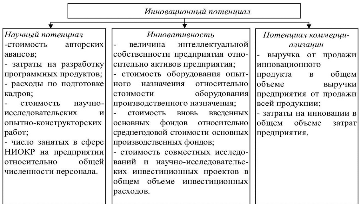
Рис. 1. Показатели инновационного потенциала промышленного предприятия.

Оцениваемые в составе инновационного потенциала предприятия величины являются показателями, характеризующими выпускаемый продукт, основные производственные фонды, используемую технологию, характеристики персонала, финансы, организационную структуру предприятия [6]. На рисунке 1 представлены оцениваемые характеристики инновационного потенциала, отнесенные к структурным составляющим последнего. Исходя из представленного состава показателей, необходимых для оценки структурных составляющих инновационного потенциала, предлагаются следующие основные оценочные показатели, показанные на рисунке 1.