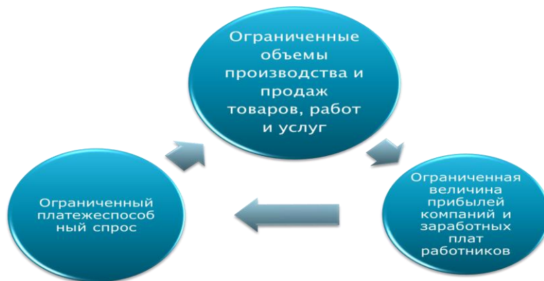
Рис. 3. Пример проблемы типа замкнутого круга на уровне национальной экономики