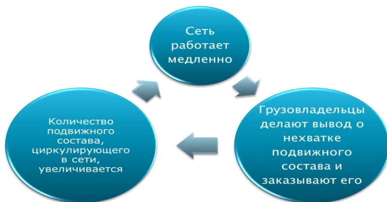
Рис. 2. Пример проблемы типа замкнутого круга на уровне подотрасли (грузовые железнодорожные перевозки)

В целом существуют успешные практики по «лечению» и даже «реанимированию» отраслей, они представлены в табл. 2. Для их реализации нужно важное условие – это рост платежеспособного спроса со стороны населения. В 2015 г. и в первом полугодии 2016 г. представители многих отраслей жаловались на существенное сжатие потребительского спроса [1; 2; 3; 4; 9]. По прогнозам из-за этой причины в России должны закрыться 6 автозаводов [8]. Следовательно, в существующих условиях для обеспечения экономической безопасности отраслей нужно подняться еще выше – на уровень национальной экономики и попытаться решить проблему замкнутого круга (см. рис. 3) уже на этой высоте.