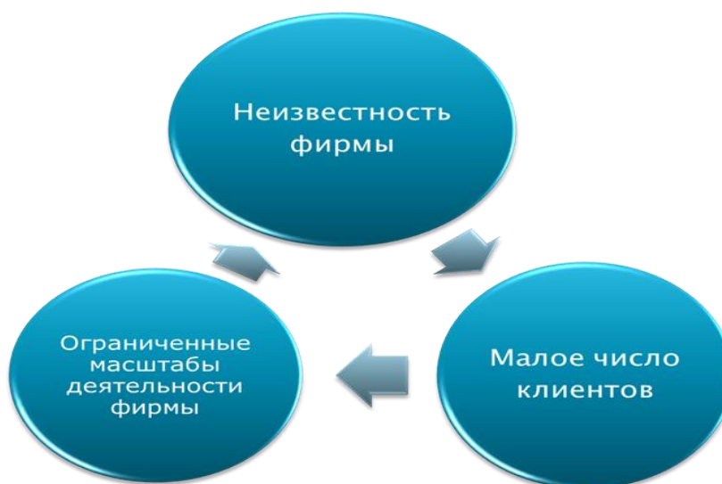
Рис. 1. Пример проблемы типа замкнутого круга на уровне фирмы

На уровне фирмы известны приемы размыкания замкнутого круга, которые представлены в таблице 1. Однако негативные последствия привлечения стратегического инвестора перевешивают позитивные эффекты, так как весьма реальна перспектива утраты сначала операционного, а потом и юридического контроля над организацией. Второй путь – прорывные решения – требуют наличия среди сотрудников фирмы работников с творческим потенциалом и талантливых копирайтеров, способных тиражировать успешные бизнес-практики. Содержание в команде «звезд» весьма накладно и существует высокая вероятность, что рано или поздно их переманят к себе другие компании.