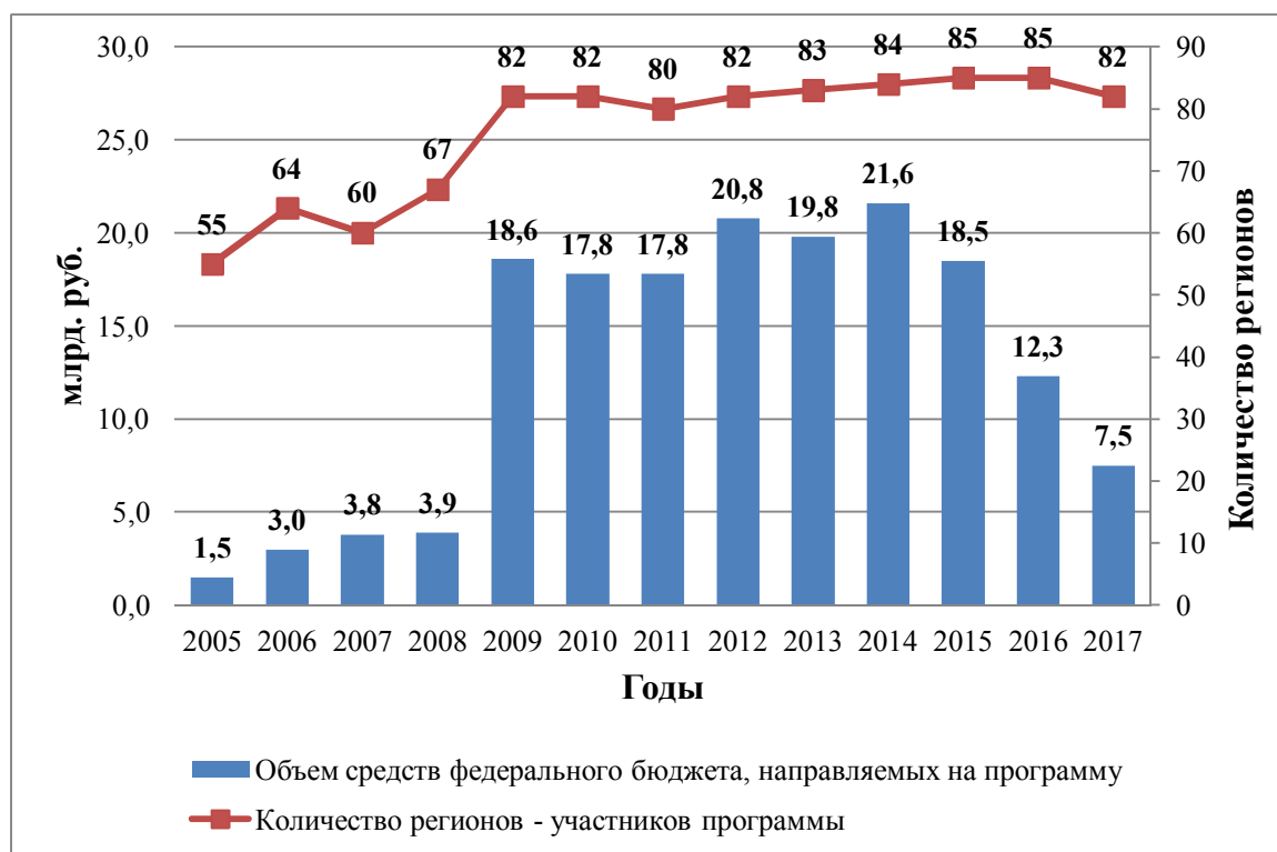
Рис. 3. Финансирование федеральной финансовой программы поддержки малого и среднего предпринимательства России за 2005-2017 гг. [6]

2770562 единиц. Конечно, не все зарегистрированные предприятия малого и среднего бизнеса участвуют в данной программе и получают субсидии, однако анализ показывает, что имеющаяся государственная поддержка пока что малоэффективна.