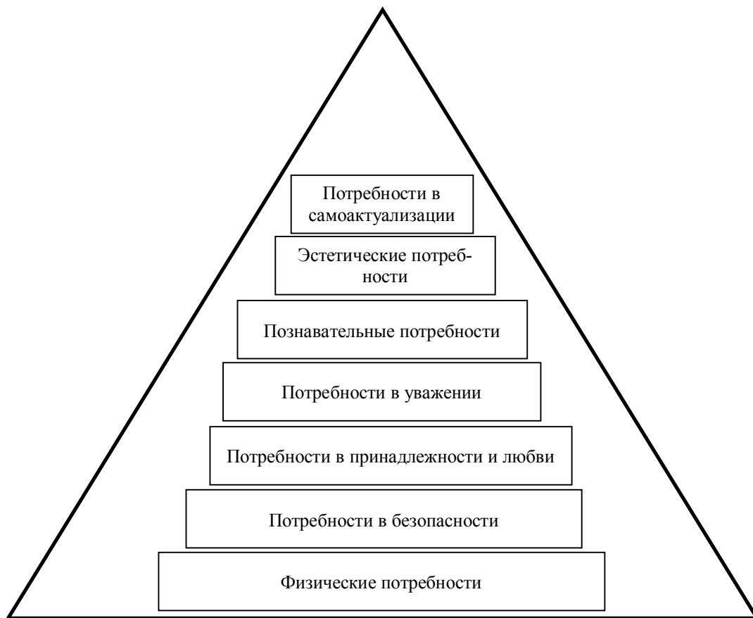
Рис. 1. Пирамида потребностей [3]

летворение потребности не всегда означает переход к удовлетворению потребностей следующего уровня.