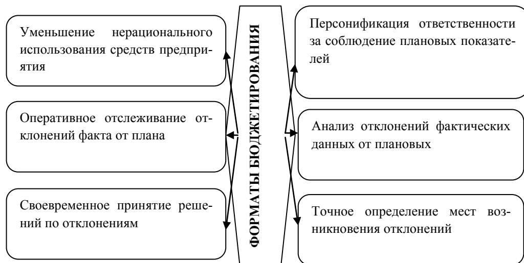
Рис. 3. Направления действия дескриптивного освоения принципов бюджетирования

Внедрение системы бюджетирования в полноценном ритме позволит решить многие задачи в управлении предприятием. На рисунке 3 продемонстрирован лишь узкий спектр тех направлений, которые могут быть усовершенствованы с применением системы бюджетирования. Необходимо отметить: в силу того, что существует множество ограничивающих факторов в повышении эффективности деятельности отраслевых комплексов в целом и предприятий в частности, идея концепции бюджетирования получает все более диверсифицированные формы; порядок формирования бюджетов изменяется под влиянием информационной энтропии.